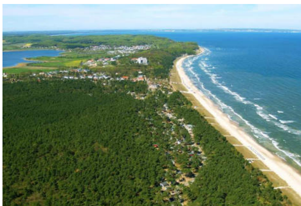
Der Strand von Baabe