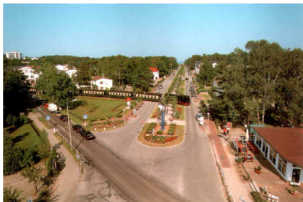
Strandstraße und "Rasender Roland"