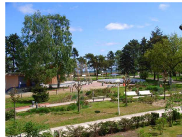
Aussicht vom Balkon über den Kurpark auf die Ostsee